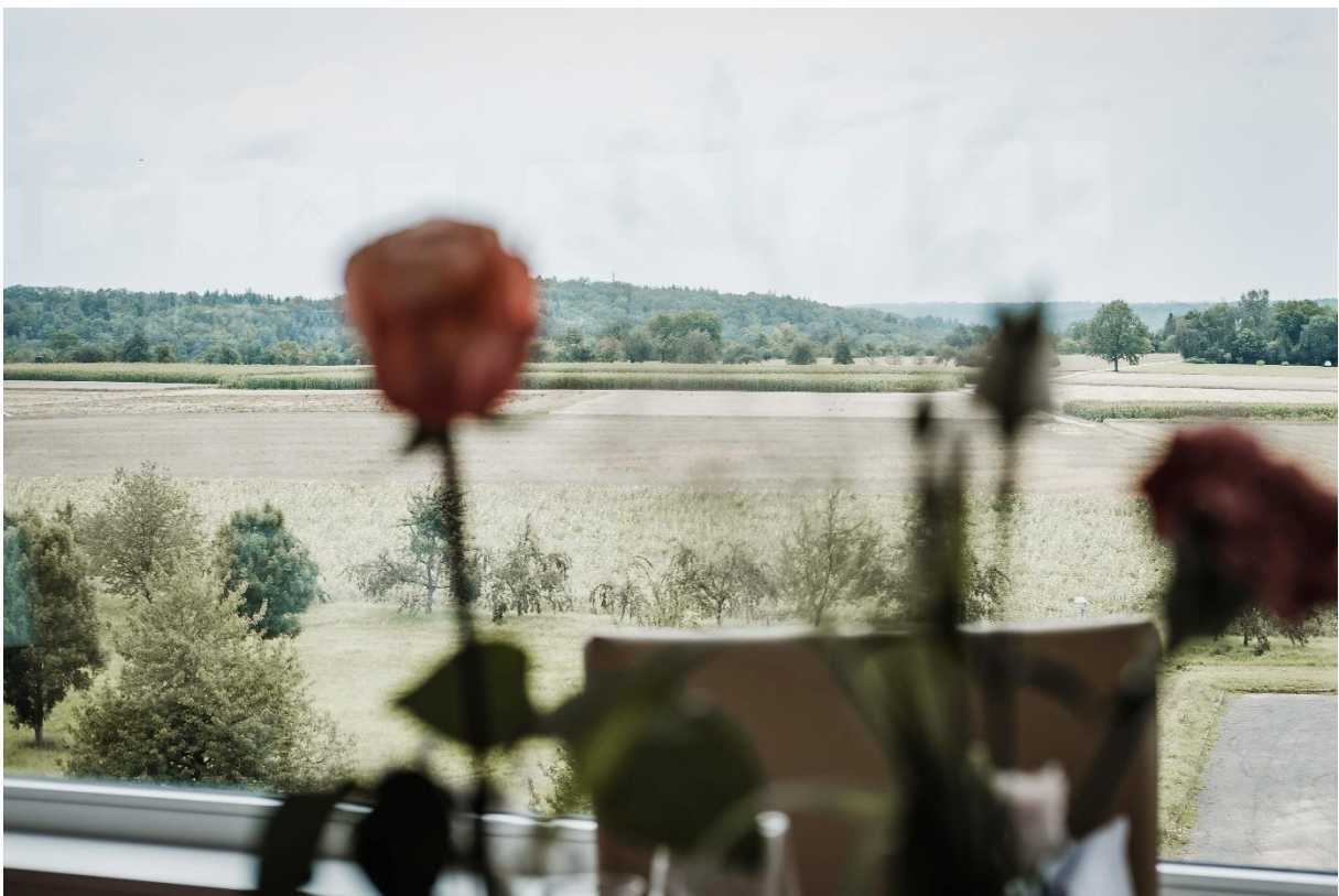
Panorama-Saal mit traumhaftem Ausblick für bis zu 200 Personen

Hotel Fortuna Reutlingen-Tübingen Carl-Zeiss-Straße 75 72770 Reutlingen